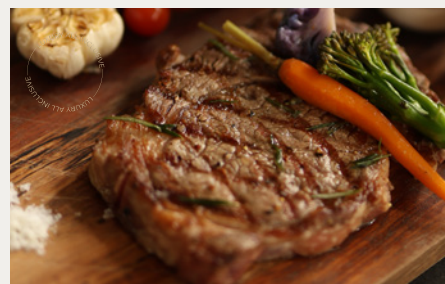
Говядина Вагю мраморностью 8-9