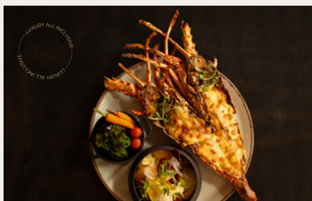
Мальдивский Лобстер Термидор