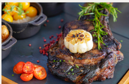
Стейк томагавк 1 – 1,2 кг из австралийской говядины Стокьярд Голд Ангус